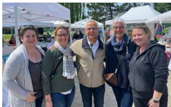
Monsieur le Maire entouré de l'équipe organisatrice

Cette édition a vu s'étoffer le concept pour vous proposer une fête conviviale autour de l'espace JKM : 30 créateurs, un groupe de musique (les Why Notes), un food truck et toujours des ateliers créatifs !