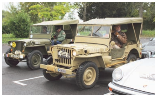
1 ER OCTOBRE : Plus d'une trentaine de participants, passionnés de belles mécaniques se sont retrouvés pour la 2 e édition du Saint-Nom Classic.