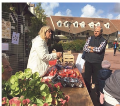
30 SEPTEMBRE : Très belle journée pour cette fête des plantes organisée place de l'Europe, par l'association Saint-Nom La Nature : vente de plantes bien sûr, mais aussi de produits locaux (fruits, légumes, miel), de produits bio (cosmétiques et d'intérieur), vins naturels, stands nature et présentation de vélos et d'outils électriques.