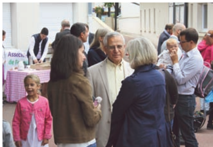
4 SEPTEMBRE : Une rentrée scolaire détendue et agréable. Les parents ont accompagné leurs enfants pour cette journée de reprise dans la sérénité. Une rentrée en musique côté élémentaire en présence d'élus municipaux et de Béatrice Piron, nouvelle Députée.