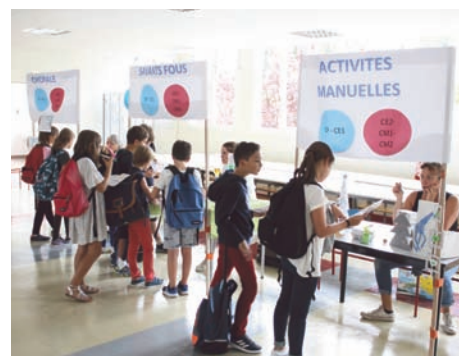
4 SEPTEMBRE : Les activités périscolaires aussi ont repris avec, cette année, l'organisation d'un Forum des NAP pour les élèves.