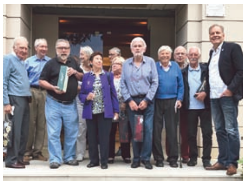
30 SEPTEMBRE : Les amateurs de bridge se sont réunis pour des parties passionnées à l'occasion de ce tournoi homologué par paires.