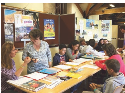
9 SEPTEMBRE : La journée des associations, un moment de rencontre avec les bénévoles pour une nouvelle année dynamique !