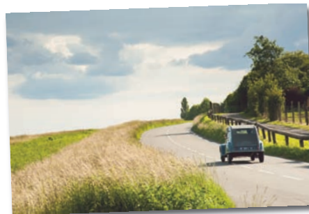
Magnifique lumière route de Chavenay. Photo lauréate présentée par Dominique BARIL.