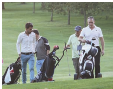
13 OCTOBRE : Une vingtaine d'équipes ont disputé sous un soleil radieux, le trophée « Patrice Galitzine » sur le green du Golf de Saint-Nom-la-Bretèche, à l'occasion de la 29 e Coupe de la Mairie, soutenue par de généreux sponsors (voir page 9).