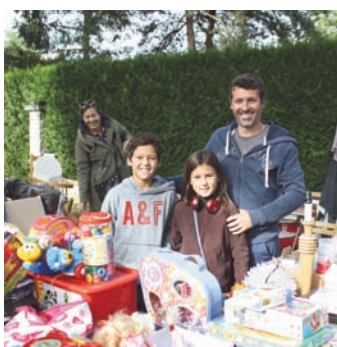
17 SEPTEMBRE : Le vide-greniers a réuni, avenue des Platanes, un grand nombre d'exposants, l'occasion de revendre des objets devenus inutiles pour certains, très utiles pour d'autres ! Aire de pique-nique, manège et animations de rue étaient également proposés par le service culturel.