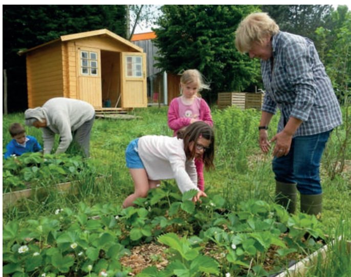
Le jardin pédagogique et les carrés potagers