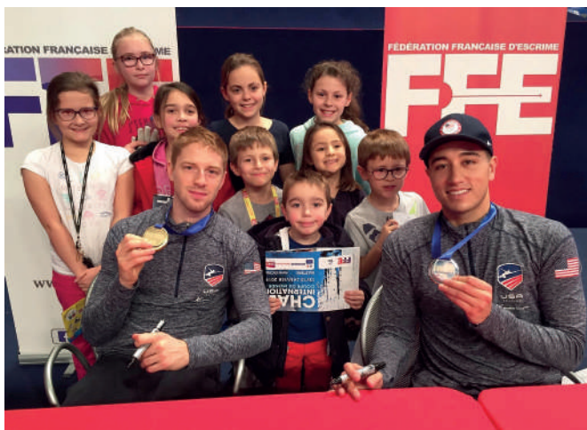
Challenge International de Paris, janvier 2019, nos jeunes tireurs avec les américains médaillés d'argent et de bronze : Gerek Meinhardt et Race Imboden

Chacun a l'occasion d'approcher l'univers de la compétition, à son rythme !