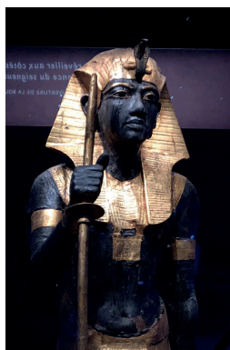
Le 12 septembre : visite de la superbe exposition « Toutankhamon »

Exposition, voyage, théâtre, ballet, restaurant étaient au programme de ce dernier trimestre :