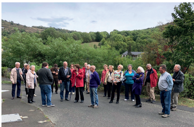
Du 27 au 30 septembre : découverte de l'Auvergne, magnifique région !

Le 20 octobre : sortie au Palais Royal pour assister à la pièce « Edmond » (5 Molières en 2017).