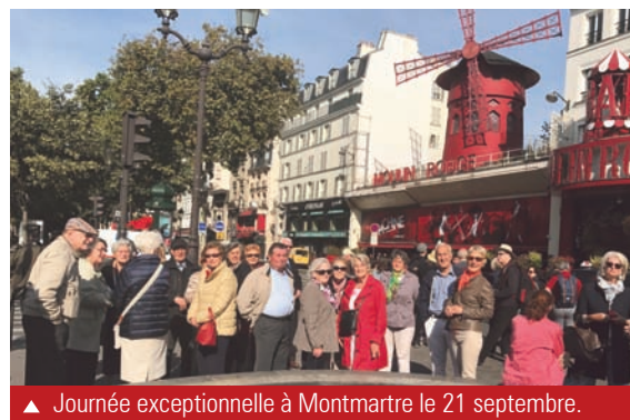
▲ Journée exceptionnelle à Montmartre le 21 septembre.

Lors de la Journée des Associations de nombreux nouveaux seniors sont venus découvrir nos activités : sorties spectacles, après-midi cinéma, repas trimestriels, marche nordique, Gymnastique Equilibre, sans oublier notre rencontre tous les mardis après-midi pour jouer au scrabble, à la belotte ou tout simplement pour passer un bon moment ensemble.