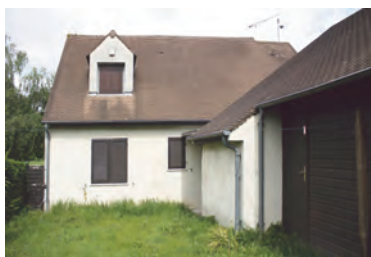
Façade Est, côté jardin. À droite le futur préau.

Nous ne manquerons pas de vous tenir informés de l'évolution de ce beau projet en faveur de notre jeunesse.